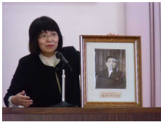
【始業式：増田顕邦先生について】

◎会議室に顔写真が掲げてあり、体育館前に顕徳碑がある「増田顕邦先生」、この人はどんな人なんだろう？