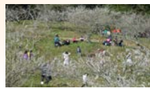
(梅花満開の中での植樹祭)

6年生を送る会(2/21)、年度末学習参観・集会(2/25)、環境美化作業・植樹祭(3/7)へのご出席ありがとうございました。一年間の本校教育活動・PTA活動を終えることができますこと、一重に地域・保護者の皆様の温かいご支援ご協力の賜と深く感謝申し上げます。(梅花満開の中での植樹祭)