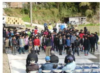
全校児童による梅コンサート

【今学校では、】2月10日(火)「言葉遣い」についての全校集会をしました。ことばは、人間関係を築く重要なもの、一方、使い方を間違えば、トラブル発生の原因にもなります。最近言葉遣いで目に余るものがあり、暴言を吐いてしまった。暴言を吐かれて悲しかった事実が明らかになりました。桜野小から暴言をなくす誓いの集会になりました。【ポスター(右)】ご家庭でも言葉遣いについて、お子さんと話し合い、ご指導をお願いします。