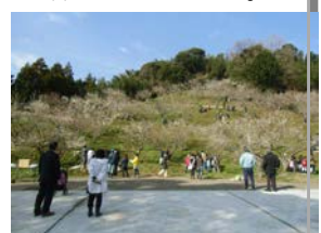
桜野小梅林を日本一の景観に