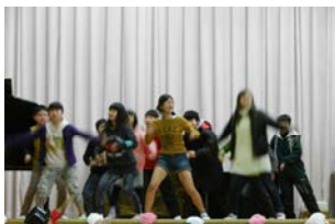
6年生「10年後の同窓会」