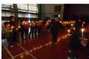
キャントムサービス 「6年生ありがとう、さようなら」