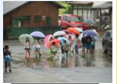
～9月1日登校風景～ 爽りの秋を思わせる、大地を潤す恵の雨のスタートになりました。

今年の夏は焼け付く猛暑、台風そして秋到来を思わせる涼しさと様々天候を感じさせる夏休みでした。社会の出来事では、今年の夏休みも悲しい水難事故があり、特にスマホLINE等による痛ましい事件には、改めて安全(防犯)規範意識、心の強さの重要性について深く考えさせられるものでした。保護者の皆様には長い夏休み、お子様の健康面、安全面でのご支援、有り難うございました。お陰様で大きな事故もなく、全児童、無事に夏休みを過ごす事が出来ましたことはこの上ない喜びであります。2学期は学校行事、学習時間が充実した学期です。保護者の皆様には1学期同様、温かいご支援の程、宜しくお願いたします。