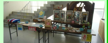
《6年生の作品コーナー》