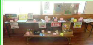
《1年生作品コーナー》

◎多くの方に観ていただきたいと工夫された作品、家族のほのぼの感溢れる力作など、9月の児童玄関フロアのファミリー作品展は心温まります。夏休みに児童の作品作りにご協力くださりありがとうございました。