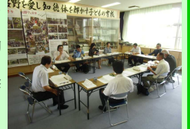
桜野小学校運営協議会