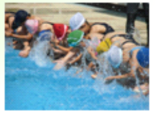
夏来る! 617 プール開き

水しぶき浴びて、夏の到来です。1学期も残り20日間となりました。環境整備作業・梅ちぎり、運動会等、保護者の皆様、地域の皆様のご支援ご協力により、素晴らしいものになりましたこと感謝申し上げます。また、7月3日(日)資源回収、7月9日(土) 参観集会・人権講演会があります。ご支援ご協力をお願い申し上げます。