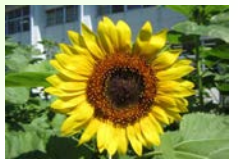
【3年生が育てた人権の花ひまわり】

保護者・地域の皆様には、学校教育活動の多大なご理解・協力をいただき、誠にありがとうございました。さて、明日から42日間という長い夏休みになります。日頃できない体験や自主的な学習等にチャレンジできる貴重な機会でもあります。また、計画的に根気強く取り組む経験もできます。子どもが目標をしっかりとって、計画的に学習できるように、また、健康・安全に留意して元気に過ごせますようご家庭での指導をお願いします。また、地域の皆様には子ども達を見守っていただきますようよろしくお願い申し上げます。