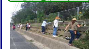
【昨年8/20環境美化作業の様子】