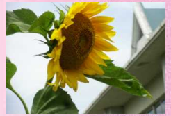
【3年生が育てた種の花ひまわり】

1学期、保護者・地域の皆様には、学校へのご支援ご協力をいただき、誠にありがとうございました。さて、42日間という長い夏休みが始まります。日頃できない体験や自主的な学習等にチャレンジできる貴重な機会でもあります。また、計画的に根気強く取り組む経験もできます。子どもが目標をしっかりとって、計画的に学習できますよう、また、健康・安全に留意して元気に過ごせますようご家庭での指導をお願いします。また、地域の皆様は子ども達を見守っていただきますようよろしくお願い申し上げます。